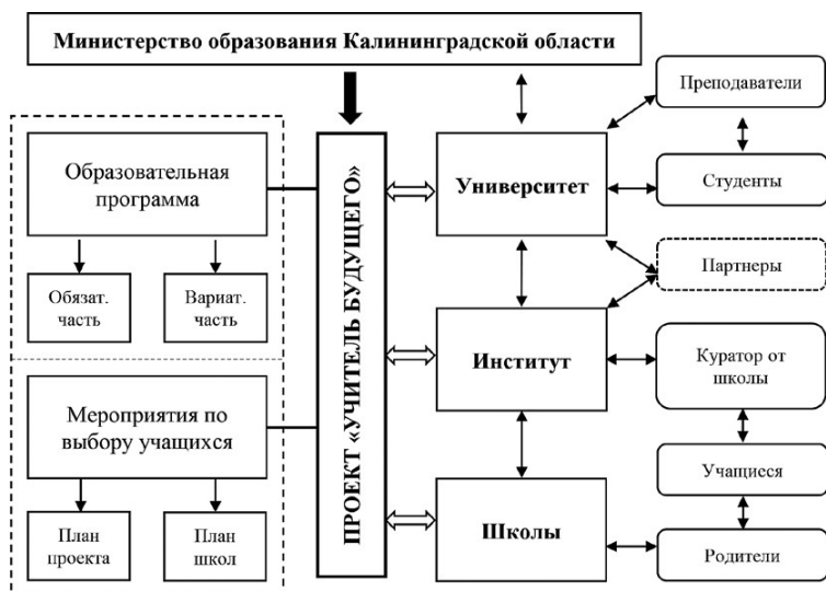
Рис. 2. Модель регионального проекта распределенного педагогического класса «Учитель будущего» (Калининградская область)

В Калининградской области воплощается в жизнь идея распределенного педагогического класса , ориентированного на учащихся 10-х классов, мотивированных к получению в будущем педагогической профессии. Школьники проходят обучение по дополнительной общеобразовательной и общеразвивающей программе «Учитель будущего» (рис. 2). Обучение проводится во внеурочное и каникулярное время, в очно-заочной форме, с применением дистанционных образовательных технологий. Условиями реализации данной формы дополнительного образования являются сетевое взаимодействие участников, сотрудничество, кооперация, социальное партнерство.